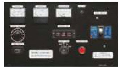
Панель управления: YEG500DSHC Панель управления: YEG500DTHC