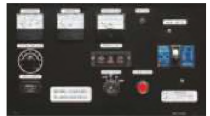
Панель управления: YEG450DSLS Панель управления: YEG450DTLS